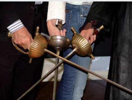
„Einer für alle, alle für einen!“ (Theatersommer 2005: Die drei Musketiere)

Ja ich möchte Mitglied beim Verein „Freunde des Haager Theatersommers“ werden und diesen durch meinen Jahresbeitrag unterstützen.